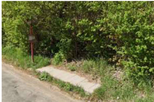
Obr. 2,3 východní a západní část autobusové zastávky „Český Brod, Zahrady“. Foto nezobrazuje nový povrch komunikace, ale věrohodně zobrazuje stav zastávek.

Autobusová zastávka v místní části Zahrady je též nevyhovující. I zde je nutné realizovat novou zastávku na obou stranách (např. jako je vzorová zastávka v ul. Havlíčkova, Český Brod).