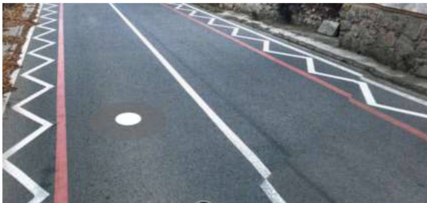
Obr 1. příklad vodorovného značení pruhů pro chodce a cyklisty

Komise vidí jako nutnost řešit bezpečnost chodců a cyklistů na komunikaci do Zahrad (od autobusové zastávky přes celé Zahrady na obou stranách) a navrhuje vodorovné značení barevných pruhů (př. viz. obr. 1). Tato komunikace je v majetku ŘSD ČR.